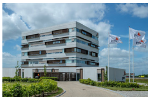
Herredsvej 32 7100 Vejle C