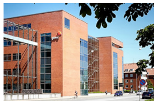
Nobelparken Jens Chr. Skous Vej 1 8000 Aarhus C