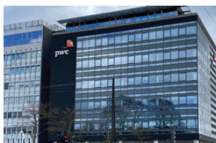
Strandvejen 44 2900 Hellerup

Bemærk, at kurser i Hellerup finder sted på Strandvejen 44 eller i nabobygningen på Philip Heymans Allé 5.