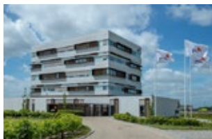
Herredsvej 32 7100 Vejle C