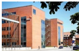
Nobelparken Jens Chr. Skous Vej 1 8000 Aarhus C